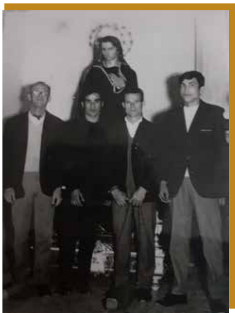
Treballadors municipals, brigada d'obres